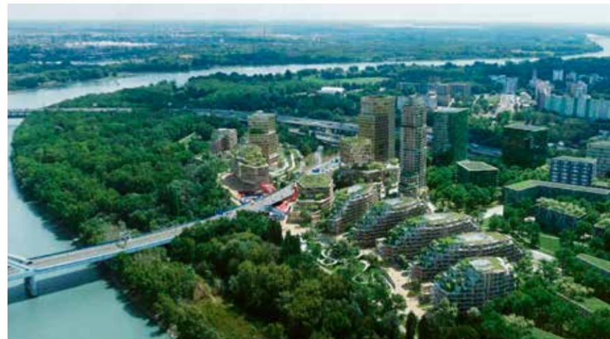
Projekt Penty Southbank na petržalskom brehu Dunaja má priniesť viac než tisíc bytov a kancelárske priestory.

Momentálne je v downtowne rozpracovaných hneď niekoľko nových projektov. Siluety možno vidieť v prípade projektu Sky Park